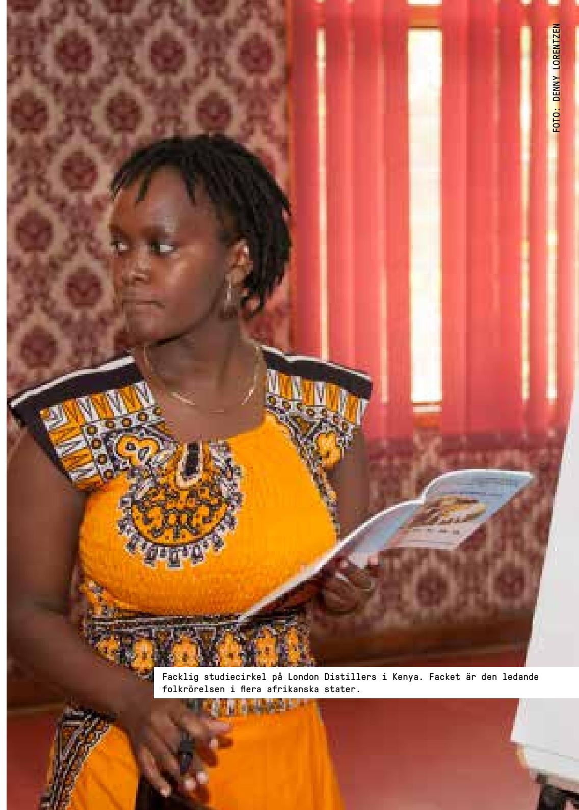
Facklig studiecirkel på London Distillers i Kenya. Facket är den ledande folkrörelsen i flera afrikanska stater.

lokalbefolkningen utan endast för européer som flyttat till de afrikanska kolonierna. Nästa steg blev att de afrikanska fackföreningarna tillät att afrikaner blev medlemmar, men fortfarande styrdes organisationerna av de fackliga kontoren i Europa. Först under 1950-talet frigjorde sig afrikanska fackliga organisationer från sina tidigare europeiska moderorganisationer. I många länder blev de fackliga rörelserna nära sammanlänkade med nationella befrielseströrelser. När allt fler afrikanska stater uppnådde nationell självständighet blev de fackliga organisationerna ofta knutna till statsapparaten. I flera afrikanska stater genomfördes statskupper och de fackliga organisationerna tvingades med våld att underordna sig statsapparaten. Från mitten av 1980-talet inleddes en ny period för de fackliga organisationerna i Afrika. I en rad länder skedde en demokratisering. Parallellt genomgick många länder en period av ekonomisk liberalisering och marknadsinslagen i ekonomierna fick ökat utrymme. Detta ledde i sin tur till att de fackliga organisationerna fick en mer självständig roll gentemot staten, arbetsgivarna och de dominerande politiska partierna. Men variationen mellan de olika afrikanska länderna och regionerna är stor och det finns många undan-