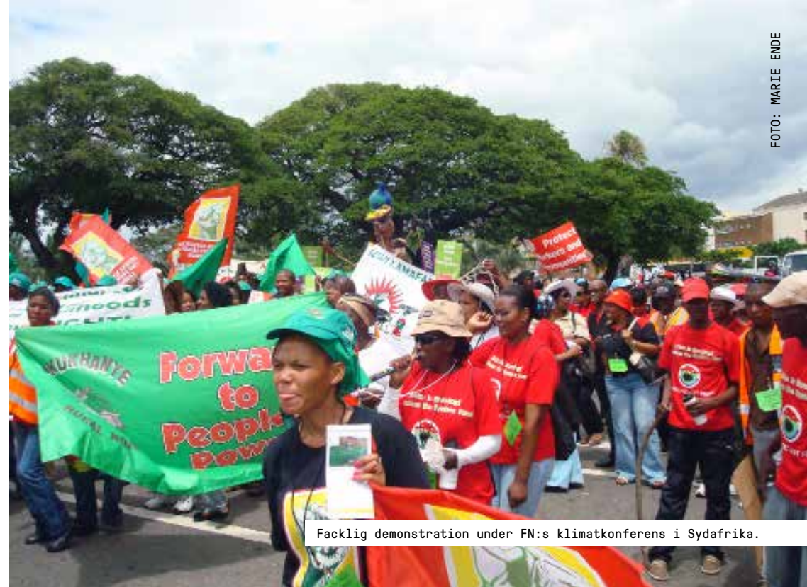
Facklig demonstration under FN:s klimatkonferens i Sydafrika.

Utän kontakter med ett lands fackliga organisationer är det svårt att förstå vad som sker i arbetslivet. Fackliga företrädare ger ett annat perspektiv än företag och myndigheter. Ett underifrånperspektiv. För att det ska vara möjligt att effektivt bekämpa fattigdomen är det viktigt att dessa röster finns med i debatten. Minskad fattigdom handlar inte bara om ekonomi – framförallt handlar det om att ge människor möjlighet att påverka sina villkor i arbetsliv och samhälle. Om bägge parterna på arbetsmarknaden erkänns – både arbetsgivare och fackliga representanter – så kan kollektivavtal upprättas som bidrar till stabilitet och