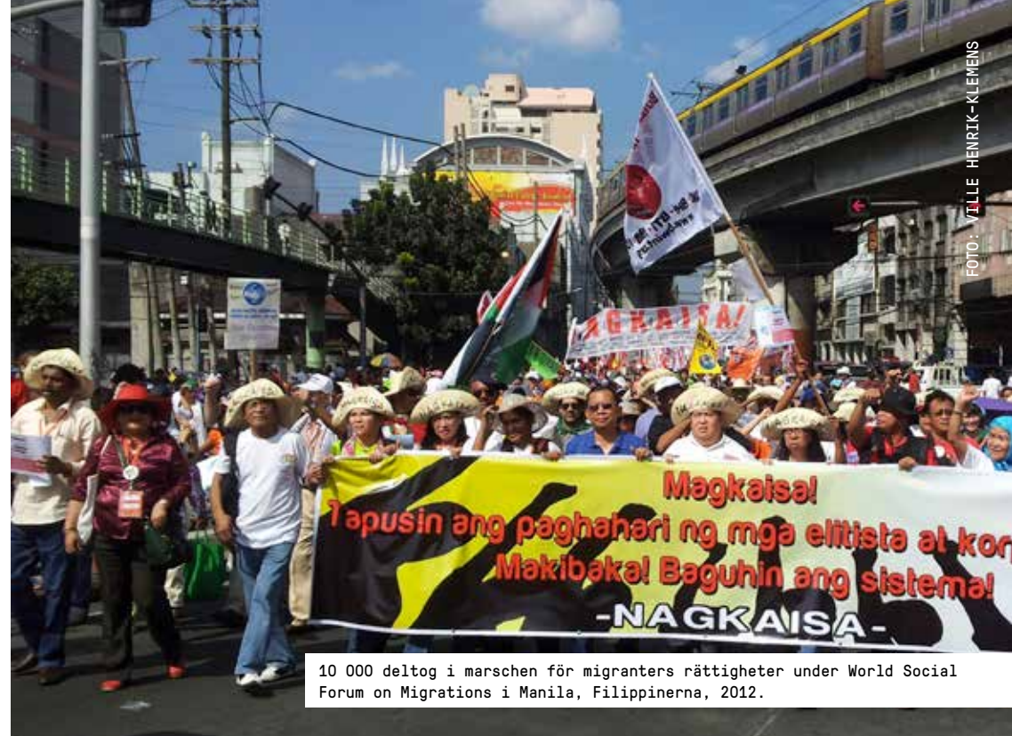
10 000 deltog i marschen för migranters rättigheter under World Social Forum on Migrations i Manila, Filippinerna, 2012.

Utän kontakter med ett lands fackliga organisationer är det svårt att förstå vad som sker i arbetslivet. Fackliga företrädare ger ett annat perspektiv än företag och myndigheter. Ett underifrånperspektiv. För att det ska vara möjligt att effektivt bekämpa fattigdomen är det viktigt att dessa röster finns med i debatten. Minskad fattigdom handlar inte bara om ekonomi – framförallt handlar det om att ge människor möjlighet att påverka sina villkor i arbetsliv och samhälle. Om bägge parterna på arbetsmarknaden erkänns – både arbetsgivare och fackliga representanter – så kan kollektivavtal upprättas som bidrar till stabilitet och