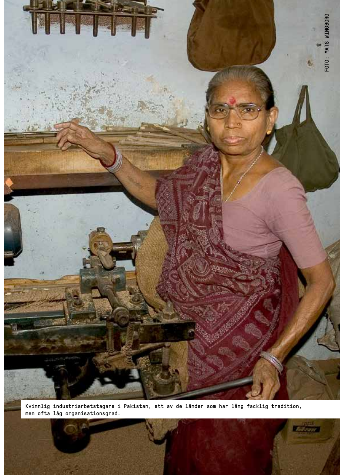
Kvinnlig industriarbetstagar i Pakistan, ett av de länder som har lång facklig tradition, men ofta låg organisationsgrad.

Fackföreningsrörelsen i de asiatiska delarna av forna Sovjetunionen – det vill säga i Kazakstan, Uzbekistan, Tadzjikistan, Turkmenistan och Kirgizistan