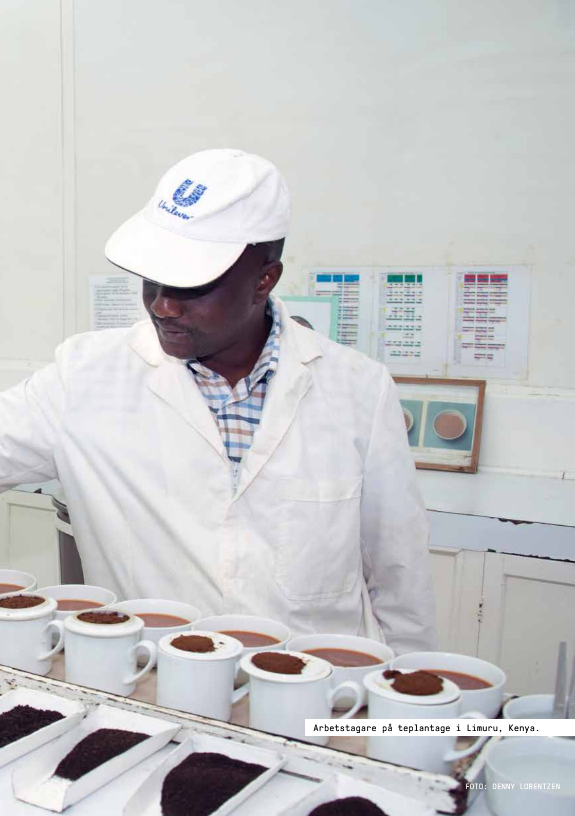
Arbetstagare på teplantage i Limuru, Kenya.