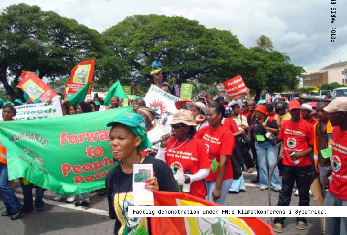
Facklig demonstration under FN:s klimatkonferens i Sydafrika.

långsiktighet i ekonomin. I forskningsöversikten Power to the People , utgiven av Internationella valutafonden, visar forskarna Florence Jaumotte och Carolina Osfria Buitron att det finns ett starkt samband mellan hög facklig organisationsgrad och jämlikhet. Det motsatta gäller också - svaga fackföreningar leder till ökade ekonomiska klyftor. I andra studier har Världsbanken visat att fungerande fackliga organisationer också skapar ökad effektivitet i ett lands ekonomi. Det finns med andra ord ett påvisat samband mellan facklig