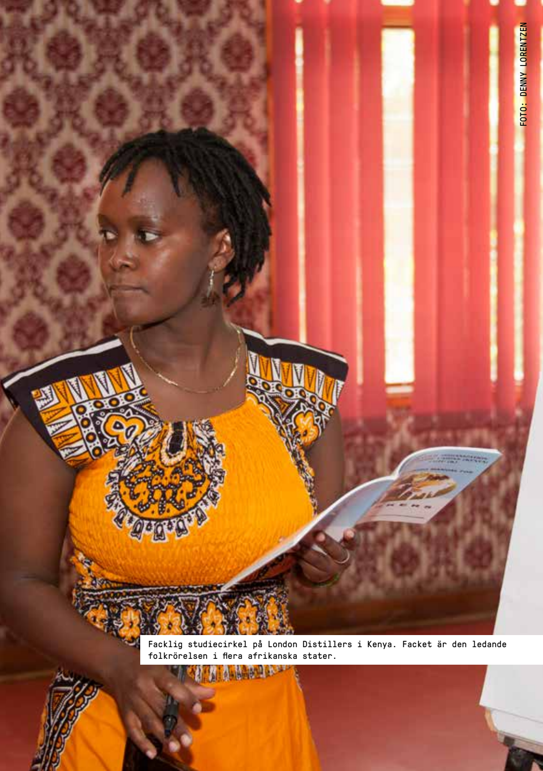
Facklig studiecirkel på London Distillers i Kenya. Facket är den ledande folkrörelsen i flera afrikanska stater.