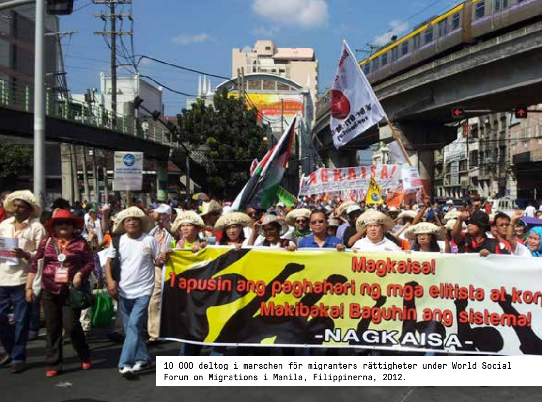
10 000 deltog i marschen för migranternas rättigheter under World Social Forum on Migrations i Manila, Filippinerna, 2012.

långsiktighet i ekonomin. I forskningsöversikten Power to the People , utgiven av Internationella valutafonden, visar forskarna Florence Jaumotte och Carolina Osfria Buitron att det finns ett starkt samband mellan hög facklig organisationsgrad och jämlikhet. Det motsatta gäller också - svaga fackföreningar leder till ökade ekonomiska klyftor. I andra studier har Världsbanken visat att fungerande fackliga organisationer också skapar ökad effektivitet i ett lands ekonomi. Det finns med andra ord ett påvisat samband mellan facklig