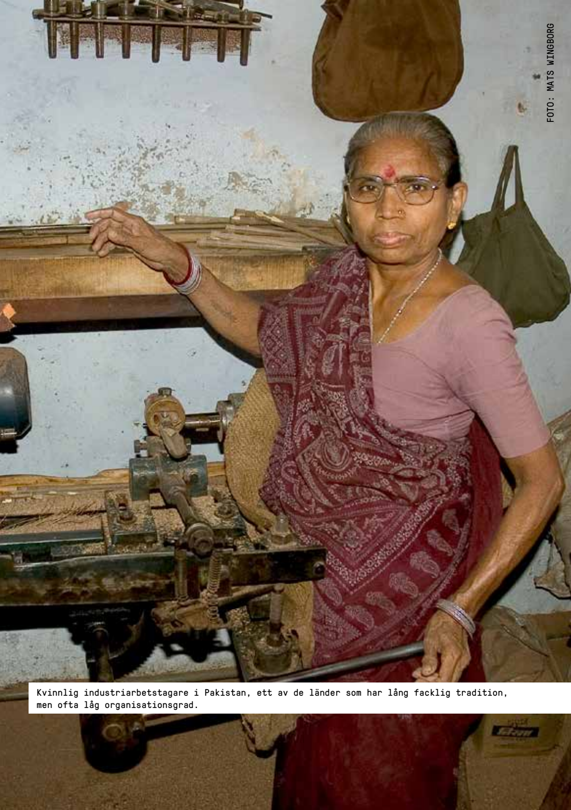
Kvinnlig industriarbetstagar i Pakistan, ett av de länder som har lång facklig tradition, men ofta låg organisationsgrad.